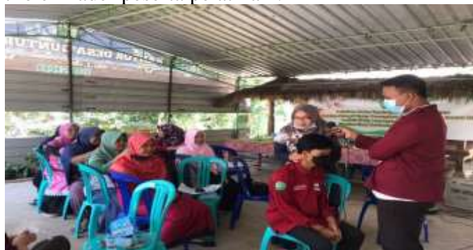
Gambar 3. peserta pelatihan praktik langsung mencoba tehnik pelaksanaan jaripuntur

Selanjutnya adalah kegiatan evaluasi dimana peserta pelatihan langsung mencoba teknik pelaksanaan jaripuntur dan bagi kader yang kurang paham akan diberikan kesempatan untuk bertanya dan diakhir kegiatan tim akan mengevaluasi lagi tehnik jaripuntur yang kurang dimengerti oleh kader peserta pelatihan .