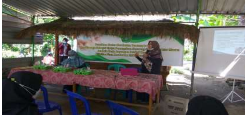
Gambar 1. pemberian materi pelatiba kader tentang jaripuntur sebagai upaya pencegahan hipertensi.