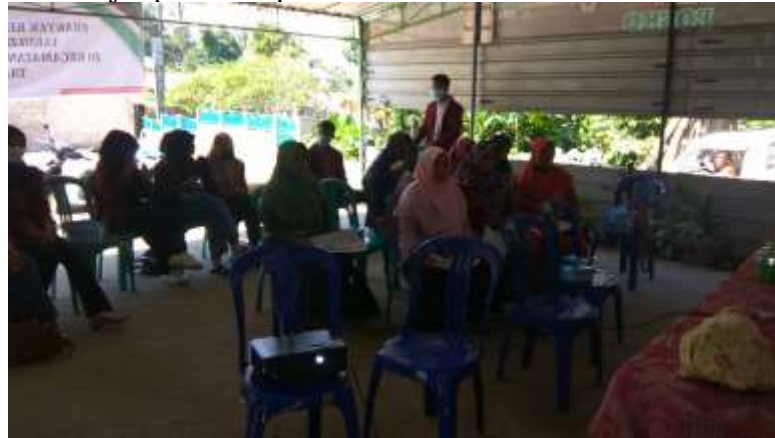
Gambar 2. kader peserta pelatihan jaripuntur

Selanjutnya adalah kegiatan evaluasi dimana peserta pelatihan langsung mencoba teknik pelaksanaan jaripuntur dan bagi kader yang kurang paham akan diberikan kesempatan untuk bertanya dan diakhir kegiatan tim akan mengevaluasi lagi tehnik jaripuntur yang kurang dimengerti oleh kader peserta pelatihan .