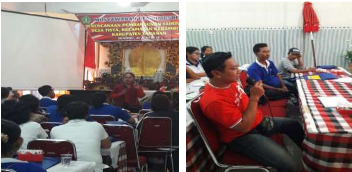
Gambar 3. Foto Kegiatan Edukasi dan Diskusi

Selain pemberdayaan kader PKK sebagai agen bank sampah, diperlukan upaya lain yang tidak kalah pentingnya dalam meningkatkan partisipasi masyarakat dalam bank sampah. Keikutsertaan masyarakat dalam pelaksanaan program bank sampah dipengaruhi oleh beberapa faktor yaitu kesadaran, norma sosial, jarak menuju agen bank sampah dan hasil yang didapatkan (Karima & Sopha, 2020). Pemodelan menggunakan metode agent based modeling , menghasilkan peningkatan partisipasi rumah tangga dalam mengelola sampah yang cukup signifikan (Karima & Sopha, 2020). Upaya membangun kesadaran hukum masyarakat yang dilakukan secara individu maupun secara berkelompok dengan peningkatan kegiatan penyuluhan perlu dilaksanakan agar pengelolaan sampah mulai dari tingkat rumah tangga dapat berjalan optimal. Selain itu, perlu dikembangkan kegiatan bimbingan teknis kepada masyarakat dalam pengelolaan sampah dan peningkatan prasarana industri pengolahan daur ulang sampah oleh pemerintah daerah (AS, Saragih, & Siswadi, 2020; Bachtiar, Hanafi, & Rozikin, 2014).