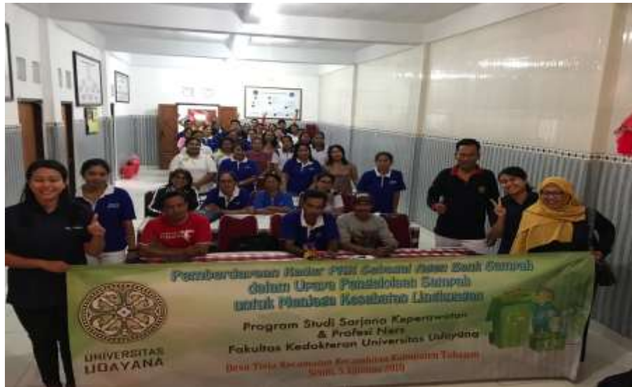
Gambar 4. Foto Bersama setelah kegiatan