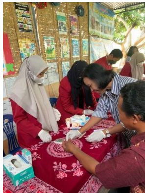
Gambar 1. Diskusi Masyarakat dengan Tenaga Kesehatan

Diskusi dilakukan bersamaan dengan pemeriksaan kesehatan. Warga yang menghadiri dapat bertanya mengenai keluhan, solusi, permasalahan kesehatan yang sedang dihadapi. Sebagai bentuk timbal balik atau feedback , tenaga kesehatan akan menanyakan tentang riwayat penyakit, obat yang dikonsumsi oleh warga dan penanggulangan jika hasil pemeriksaan dinyatakan tidak normal.