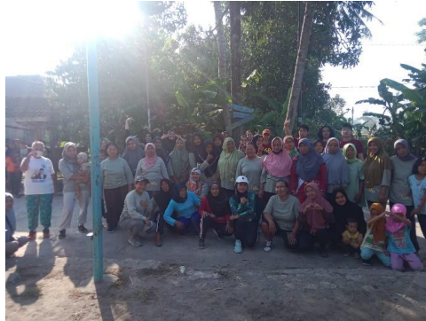
Gambar 3, Program Senam Sehat

Jumlah peserta atau masyarakat yang ikut serta melampaui target dengan 66 orang. Hal ini menunjukkan tingkat partisipasi dan antusias yang tinggi dari masyarakat. Selain itu, masyarakat merasa puas dan sangat terbantu dengan adanya kegiatan ini untuk melanjutkan kelangsungan hidup. Kegiatan ini juga menjadi bahan evaluasi untuk program desa untuk mencapai masyarakat yang sejahtera dan sehat. Kampung Bebekan, Dusun Destan memutuskan untuk melaksanakan program senam sehat yang diselenggarakan setiap hari Minggu sebagai bentuk perubahan gaya hidup untuk menjaga kesehatan dan terhindar dari penyakit, terutama penyakit tidak menular.