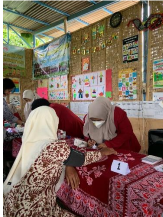
Gambar 2. Praktik Langsung Pemeriksaan Tekanan Darah