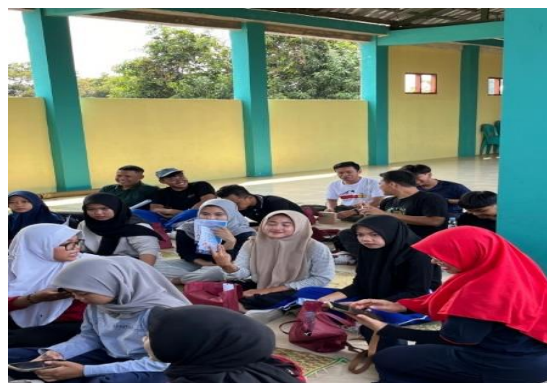
(Gambar 4 Demonstrasi 1)