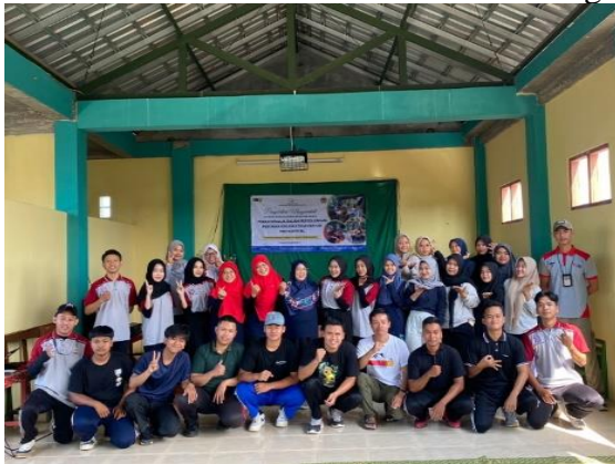
( Gambar 1 Tim PKM dan peserta )