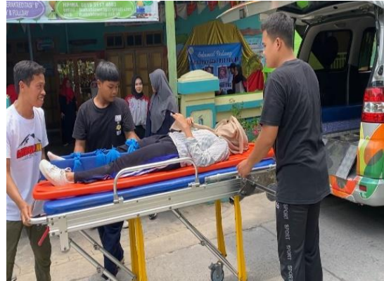
(Gambar 6 Simulasi kecelakaan )

Karakteristik responden yang digunakan pada pengabdian masyarakat adalah remaja yang berusia 16-20 tahun. Hal ini didasarkan pada usia tersebut remaja sudah mempunyai keleluasaan untuk bersosialisasi dan juga mengeksplorasi hal-hal baru serta mempunyai rasa ingin tahu yang tinggi namun dengan kurangnya pengetahuan. Penelitian (Rahim et al., 2021) menyatakan bahwa semakin sering seseorang terpapar informasi, maka tingkat pengetahuannya juga akan semakin baik, terlebih jika informasi tersebut dilengkapi dengan praktik. Pengabdian masyarakat dengan tema peran remaja dalam pertolongan pertama kegawatdaruratan pre hospital akan menambah pengetahuan dan ketrampilan remaja terhadap penanganan pertama kegawatdaruratan sebelum korban dibawa ke rumah sakit akan sangat menentukan keselamatan korban. Hal ini sesuai dengan (Imardiani et al., 2020) yang menyatakan betapa pentingnya tindakan P3K maka dapat menjadi aspek yang harus dikelola dan diimplementasikan pada semua komponen institusi. Terutama bagi masyarakat di mana kecelakaan dan pertolongan pertama sering dialami, sehingga pengetahuan dan keterampilan masyarakat pada pertolongan pertama sangatlah penting.