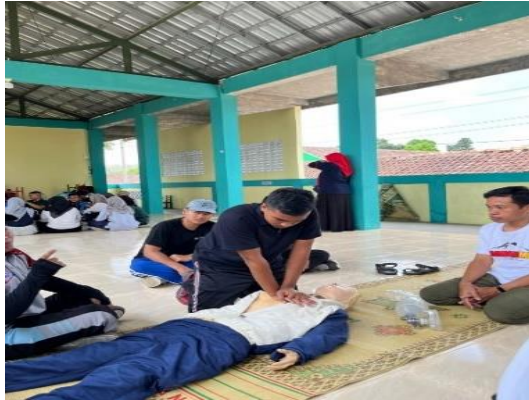
(Gambar 5 Demonstrasi 2 )