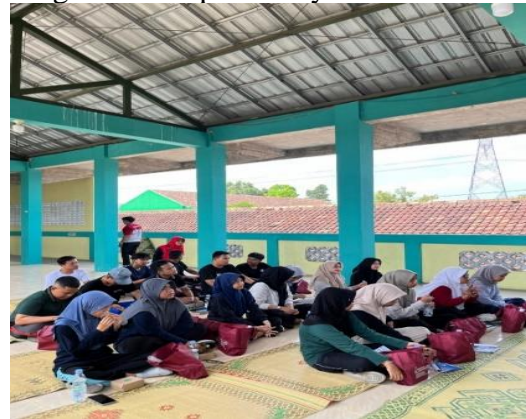
(Gambar 2 Pemaparan Materi )