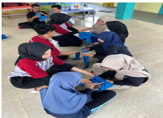
(Gambar 3 Tanya Jawab )