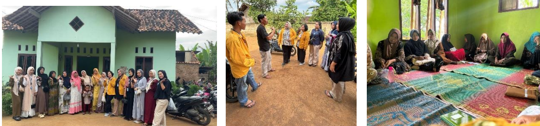
(Dokumentasi Foto Bersama)

Hasil pre-test dan post-test menunjukkan adanya peningkatan pengetahuan peserta setelah mengikuti penyuluhan. Rata-rata nilai pre-test sebesar 4,05 meningkat menjadi 5,90 pada post-test. Selain itu, jumlah peserta dengan skor rendah menurun, sedangkan yang memiliki skor sedang hingga tinggi meningkat. Hal ini membuktikan bahwa penyuluhan tentang pemanfaatan tanaman serai wangi efektif dalam meningkatkan pemahaman masyarakat. Berikut dokumentasi kegiatan selama pengabdian berlangsung :