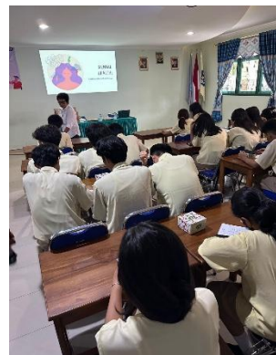
Gambar 2. Pengisian Pre-Test