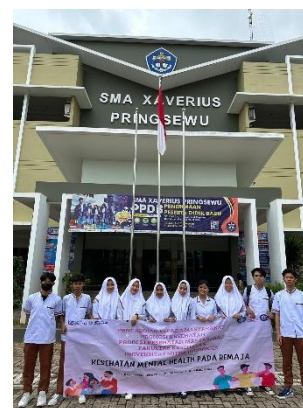
Gambar 4. Anggota Penyuluhan