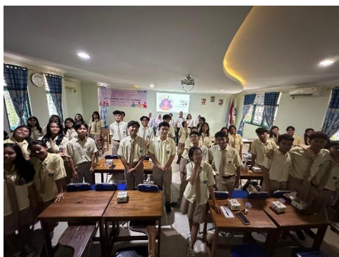
Gambar 3. Dokumentasi Bersama