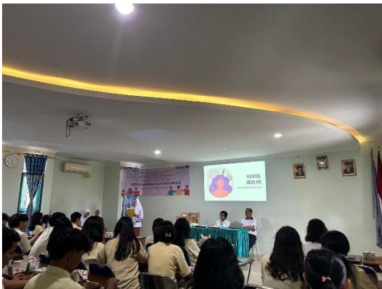
Gambar 1. Pembukaan Kegiatan

Sehingga kegiatan ini berhasil meningkatkan pengetahuan siswa tentang Kesehatan mental, sehingga siswa dapat lebih memperhatikan kondisi Kesehatan mentalnya dimasa depan